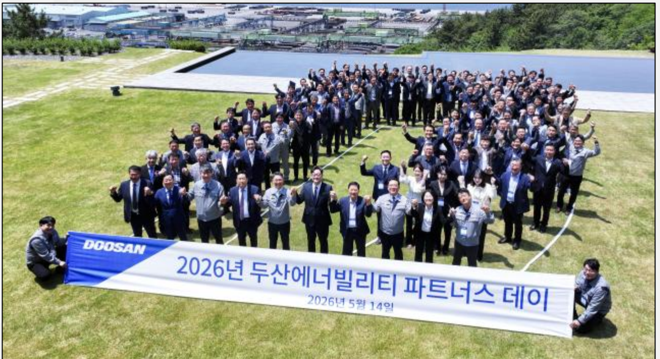
< 2026년 두산에너지빌리티 파트너스 데이 >

두산에너지빌리티는 자사의 수출입 안전관리에서 한 걸음 더 나아가 공급망 전체의 경쟁력 향상으로 그 가치를 확장하고 있다. 협력사와 함께 성장하는 공급망 구축이야말로 글로벌 시장에서 안정적인 경쟁 우위를 확보하기 위한 핵심 전략이 되고 있다.