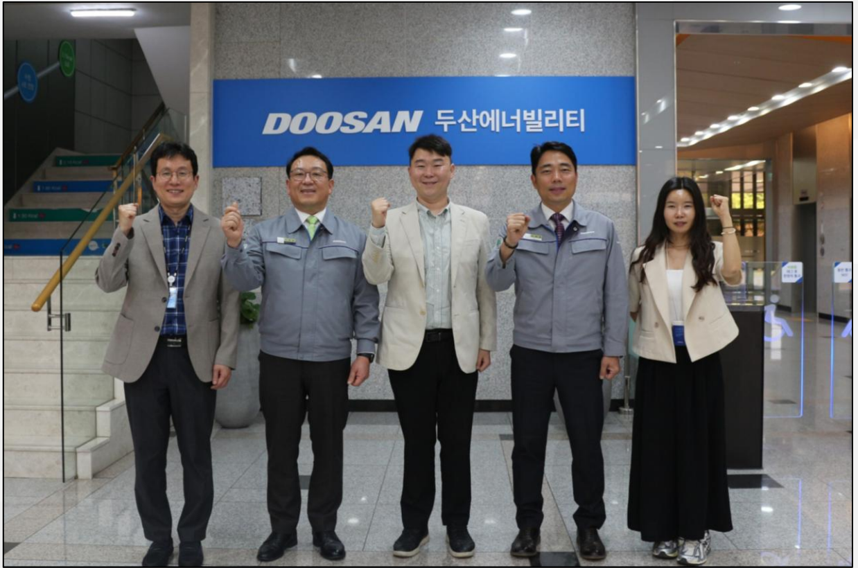
< 두산에너빌리티 임직원과 협회 임직원의 단체사진 >